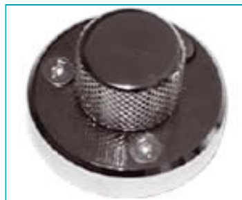
Круглая ручка для опускания вальцов выполняемой программы