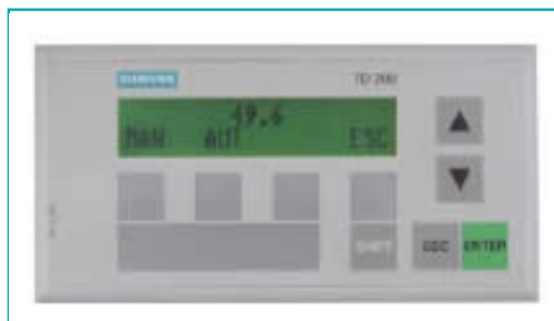
Панель для программирования автоматического опускания вальцов выполняемой программы